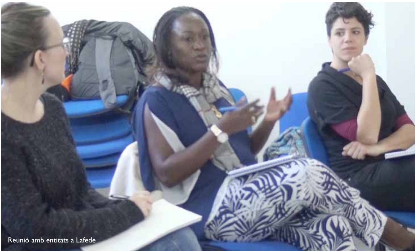
Reunió amb entitats a Lafede

Tot i això, la Caddy és optimista i lluitadora: està convençuda que l'activisme de tantes i tantes dones portarà el canvi, el respecte als seus drets...El camí serà llarg.