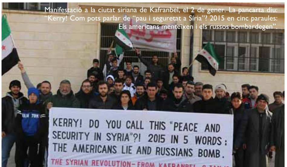
Manifestació a la ciutat siriana de Kafranbel, el 2 de gener. La pancarta diu: "Kerry! Com pots parlar de "pau i seguretat a Síria"? 2015 en cinc paraules: Els americans menteixen i els russos bombardegen".

De manera misteriosa, una branca d'Al-Qaida a l'Iraq, a la qual s'havien unit antics oficials del règim de Sad-