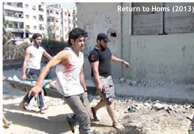
Return to Homs (2013)

Ara les flors fugen de Síria i intenten entrar a una Europa a qualsevol preu (un preu ben alt). Fugen també de l'Iraq, de l'Afganistan, de Líbia... alguns són considerats refugiats, d'altres immigrants, però tots s'allunyen de l'horror, sigui de les armes o de la pobresa.