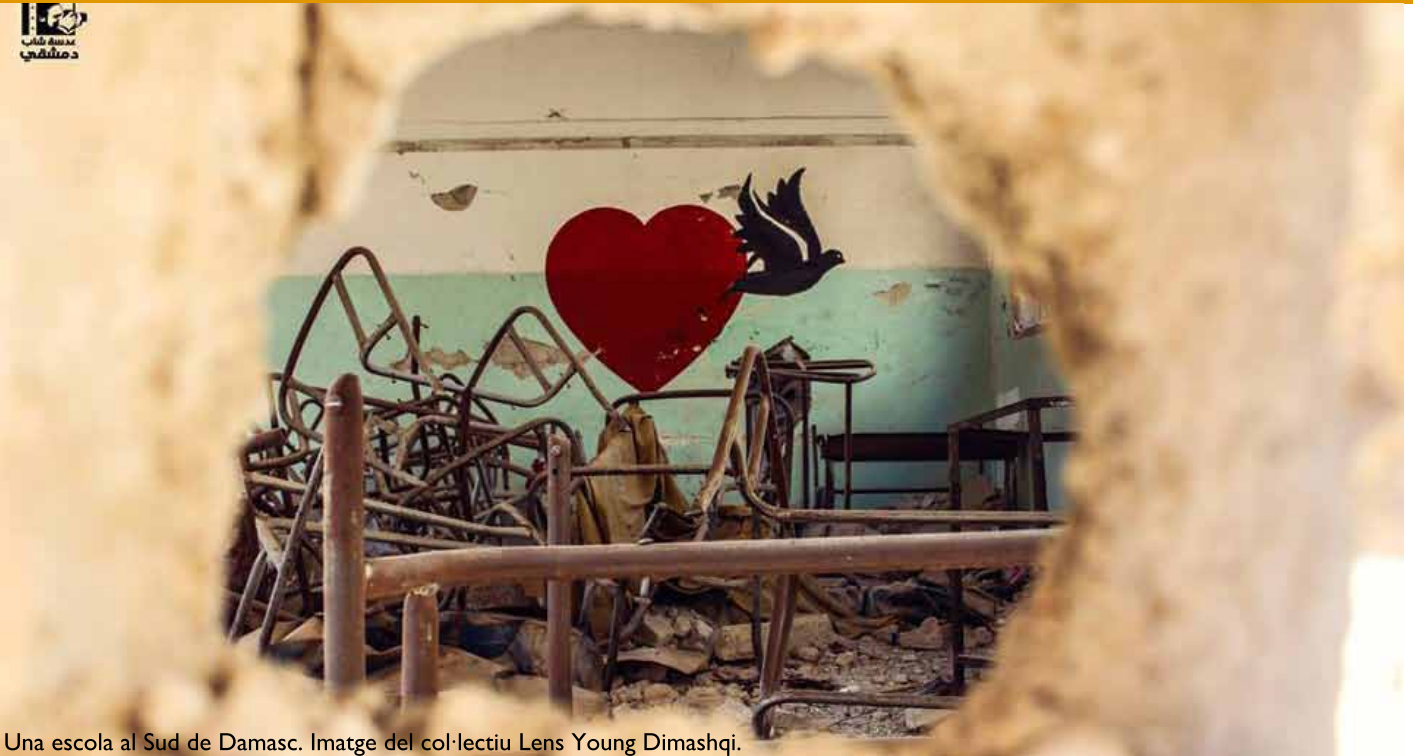
Una escola al Sud de Damasc.

centenars de centres que conformaven un autèntic arxipèlag del terror on es torturava milers de presos polítics.