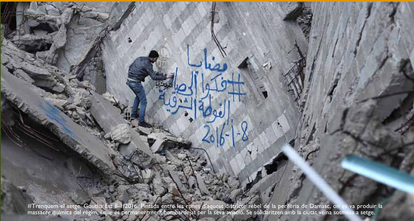
#Trenquem el setge. Goutha Est 8-1/2016. Pintada entre les runes d'aquest districte rebel de la perifèria de Damasc, on es va produir la massacre química del règim, i que és permanentment bombardejat per la seva aviació. Se solidaritzen amb la ciutat veïna sotmesa a setge.