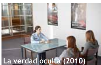
La verdad oculta (2010)

Tot el film és, doncs, un repàs de les atrocitats comeses. Un compendi dels delictes a mans dels militars serbis durant la guerra: la proliferació de francotiradors i la seva sang freda; recent nascuts morts de manera absolutament salvatge; camps de concentració; els efectes devastadors del setge de Sarajevo; el sadisme sense límits... però, sobretot, la violència contra la dona.